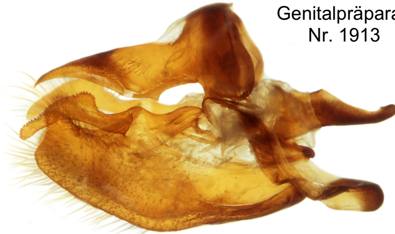
Lateralansicht anatomisch rechts