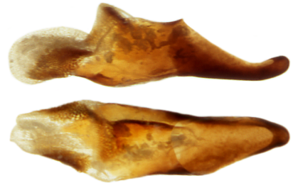
Aedoeagus Lateralansicht oben Gedreht bis Dorsalansicht unten