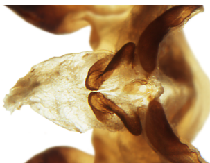
Dorsalansicht siehe das getrennte Tegumen mit Scaphium und Analausgang