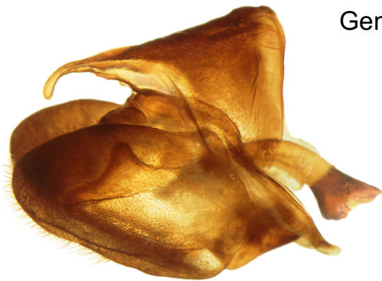
Lateralansicht anatomisch rechts mit Supra-Uncus