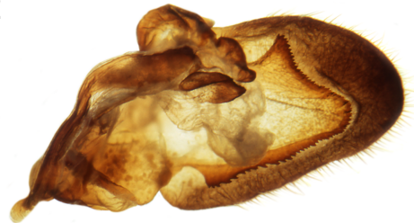
anat. rechteValve Innenseite mit Tegumen und Scaphium