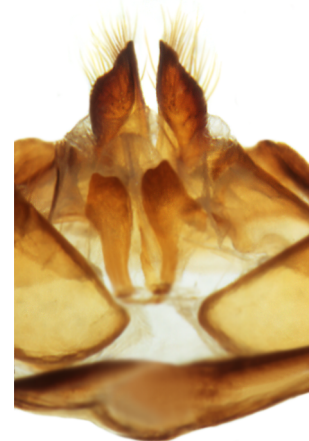
Ventralansicht Aed sep siehe getrenntes Tegumen und Furca