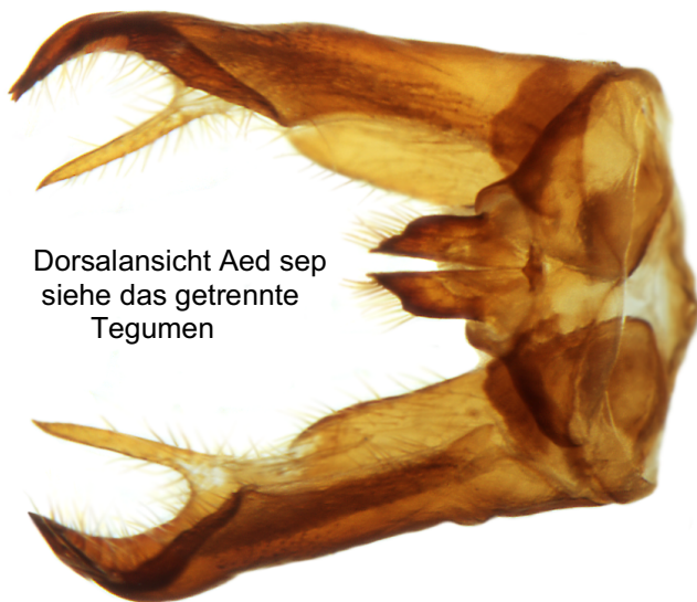
Dorsalansicht Aed sep siehe das getrennte Tegumen