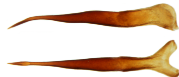
Aedoeagus oben Lateralansicht gedreht bis unten Dorsalansicht