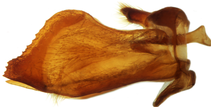
Lateralansicht anatomisch rechts