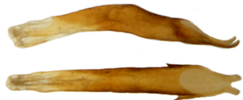
Aedoeagus Lateralansicht oben gedreht bis Dorsalansicht unten