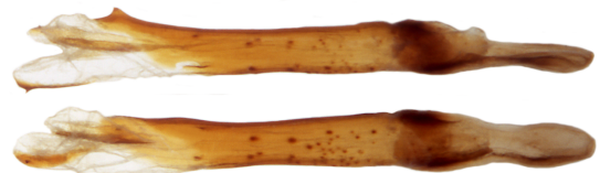
Aedoeagus Lateralansicht oben gedreht bis Dorsalansicht unten