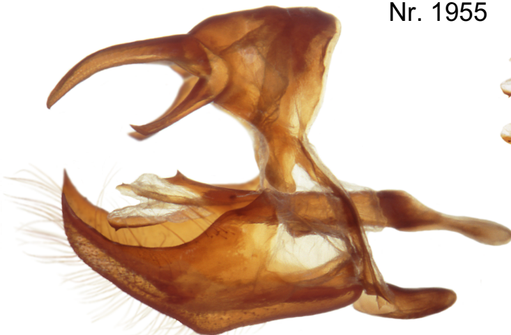
Lateralansicht anatomisch rechts