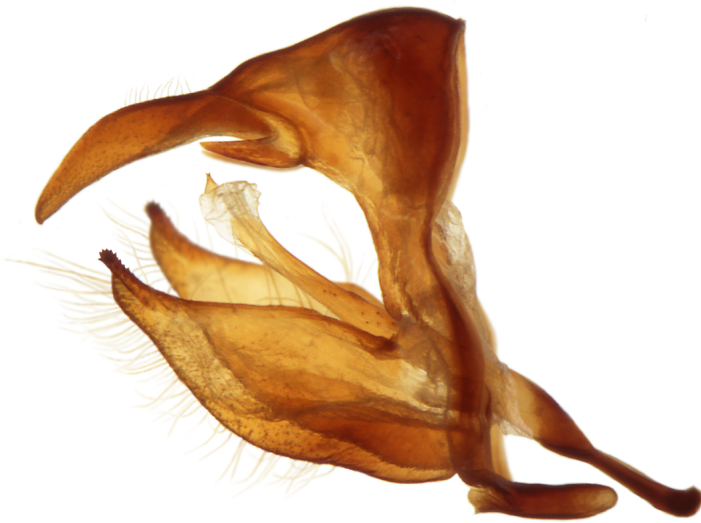
Lateralansicht anatomisch rechts

Tegumen und Uncus etwa gleich lang. Uncus in der Mitte dorsad überhöht. Die geraden, kurzen Subunculi liegen zum Uncus parallel. Die Valve ist von der Basis bis zur Mitte etwa gleich breit und verjüngt sich anschließend, kontinuierlich bis zum Terminal. Der Apex ist horizontal flach im Bogen angeordnet (siehe Dorsalansicht) und mit kleinen Zähnchen besetzt. Der Costalrand kann eine kleine zahnlose Aufwölbung zeigen. Der Saccus ist relativ lang. Der gerade Aedoeagus ist immer länger als die Valve. Er ist mit variablen Cornuti bestückt. Das Phalotrema liegt ventral.