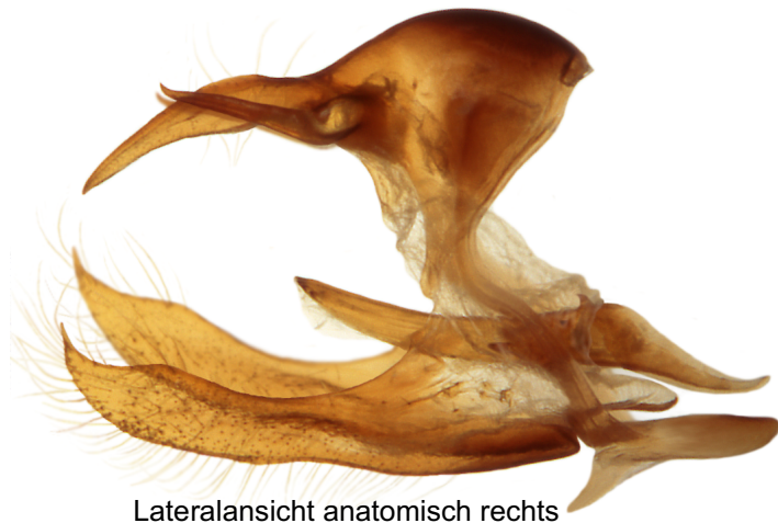
Lateralansicht anatomisch rechts