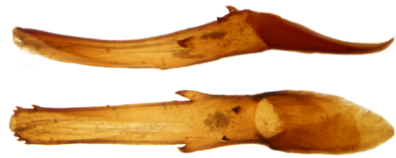
Aedoeagus Lateralansicht oben gedreht bis Dorsalansicht unten